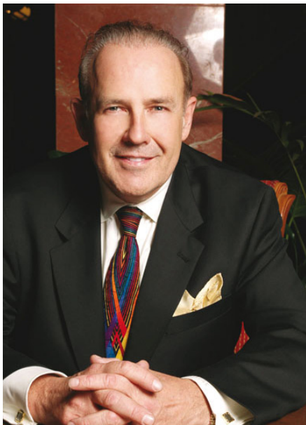
JOHN TSCHOHL Presidente

Después de 39 años de experiencia, Service Quality Institute es el líder global en ayudar a las organizaciones a crear una cultura de servicio, construida alrededor del Facultamiento de los empleados para subir el nivel de servicio al cliente y solucionar sus problemas de manera rápida y decisiva. Este es el máximo nivel a alcanzar para ofrecer un servicio excepcional al cliente.